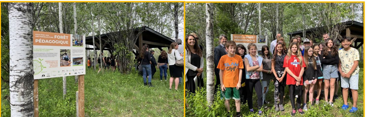
Le panneau et la structure en bois de la forêt pédagogique. Des élèves et représentants des organisations partenaires.