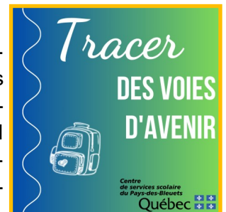
Logo : Marie-Eve Bernard

Le Service des communications et le Service des ressources humaines ont travaillé conjointement sur ce projet d'envergure : une série de baladodiffusion de douze épisodes nommée « Tracer des voies d'avenir » dont l'objectif est de mieux faire connaître les différents milieux de travail du CSSPB. Chaque épisode met en valeur un lieu de travail (écoles primaires, centres administratifs, écoles secondaires, centre de formation professionnelle, centres de formation générale des adultes, etc.) avec des invités et des témoignages de membres de son personnel. La série est disponible sur la plupart des plateformes de baladodiffusion : Balado Québec, Spotify, Apple et Google.